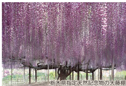
栃木県指定天然記念物の大藤棚

約1,300年の歴史と伝統を誇る機業地足利の守護神が奉られており、産業振興と縁結びの神様として広く市民に親しまれています。朱塗りの社殿は、国の登録有形文化財に指定されているほか、平成26年度には、「恋人の聖地」「日本夜景遺産」に認定されました。